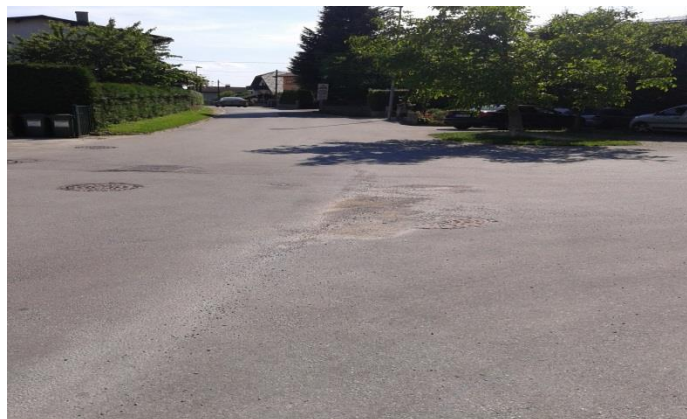
SLIKA 3: Špindlerjeva ulica