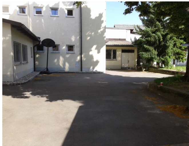
SLIKA 2: Domsko dvorišče