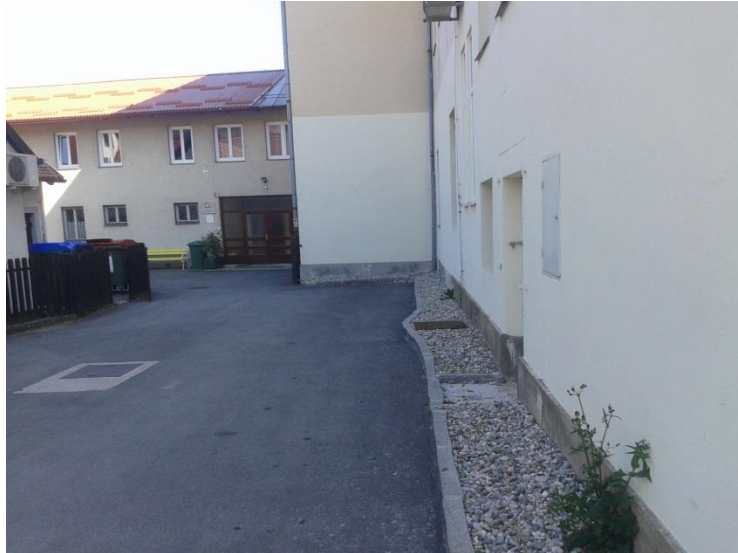
SLIKA 1: Šolsko dvorišče in parkirišče za Ljudsko univerzo